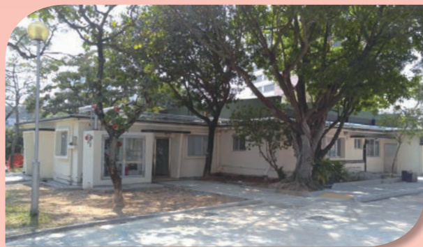
醫院管理局社區復康中心